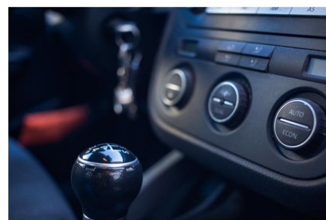
Bluetooth対応機器との連携