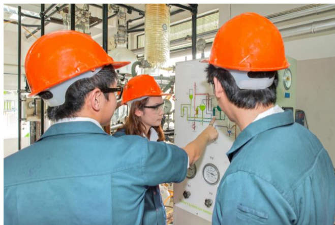
特定エリアの入場制限