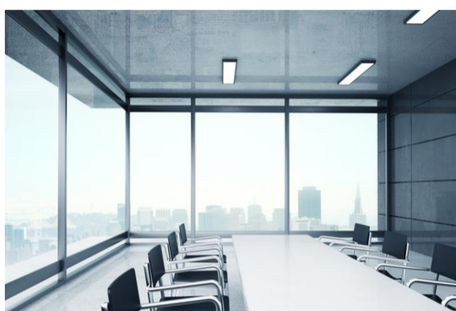
オフィスのセキュリティ全般