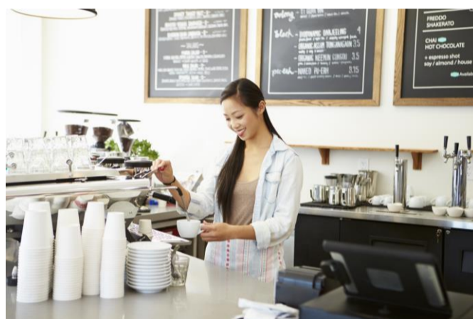
チェーン店の勤怠管理